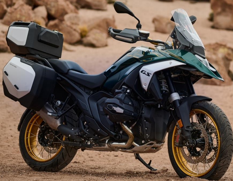
Abbildung mit Sonderzubehör