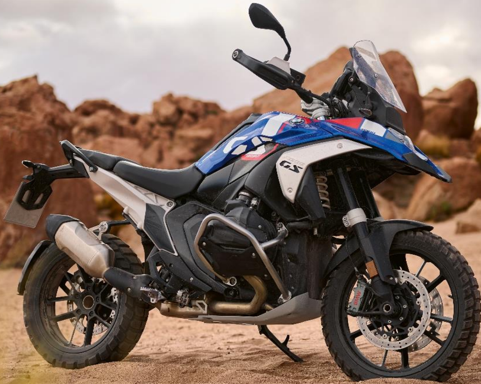
Abbildung mit Enduroschmiederädern